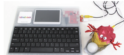
特製カニロボセット